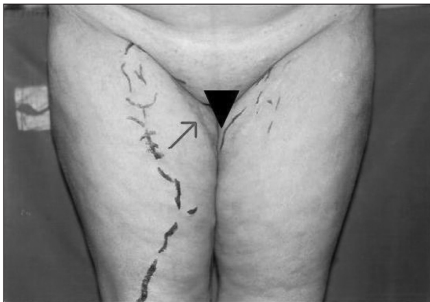
Figura 1. Marcação do trajeto das varizes recidivadas a partir da junção safeno-femoral. A seta indica a presença de cicatriz da operação anterior em localização distal à preconizada.

O mapeamento com eco-color Doppler foi realizado em todos os doentes do estudo, em serviços de ultrassonografia diferentes, de acordo com a orientação do seguro saúde de cada paciente. Na solicitação deste exame foi especificado que se tratava de recidiva de varizes e pediu-se a verificação do sistema venoso superficial e profundo, bem como a avaliação da presença de veias perforantes.