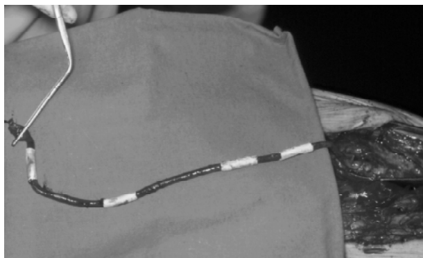
Figura 2 - As quatro dilatações foram recobertas

ro com um balão de 3 mm. Não foi possível, no entanto, descer o balão à artéria tibial anterior. A oclusão da ponte deveu-se à deficiência de um leito distal, e não à técnica de revestimento.